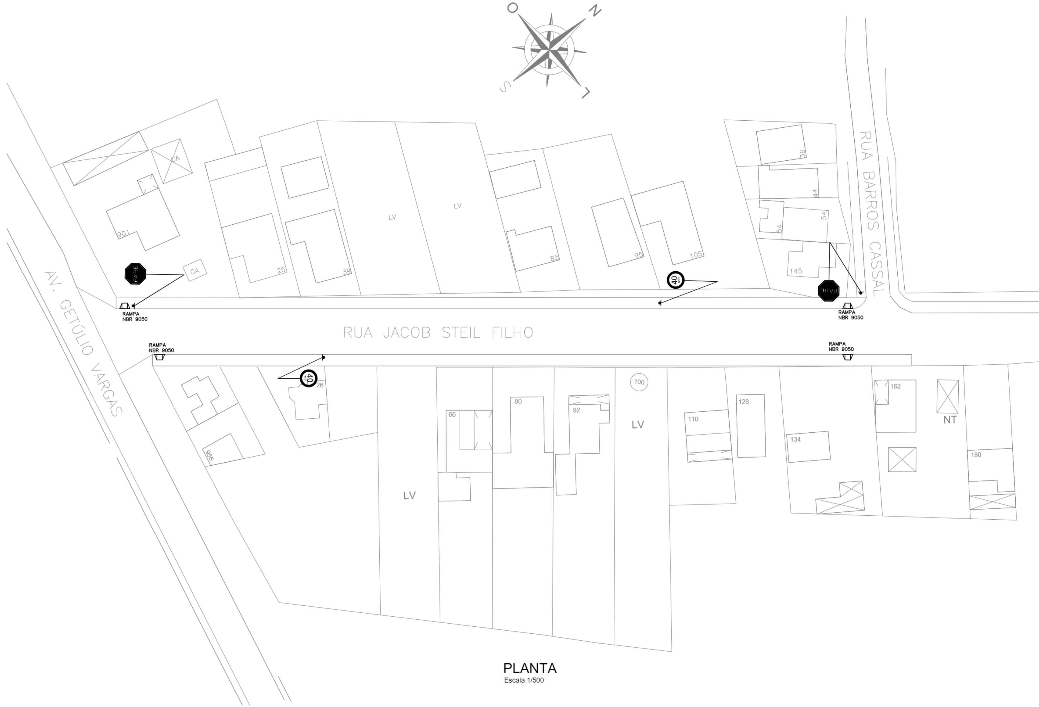
PLANTA Escala 1/500